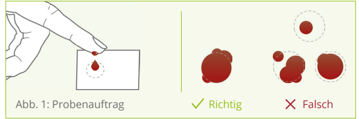
Abb. 1: Probenauftrag

des Spots ist so gewählt, dass 50 µl Blut aufgenommen werden können. Es ist es daher sehr wichtig, soviel Blut aufzutropfen, dass der Spot von beiden Seiten vollständig mit Kapillarblut vollgesogen ist. Bitte füllen Sie nur einen Spot mit Blut.